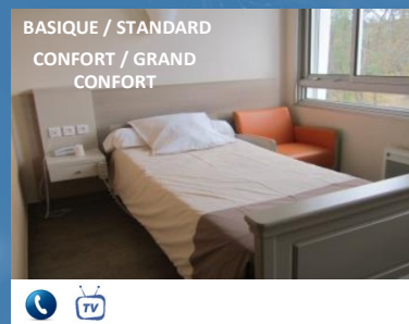
BASIQUE / STANDARD CONFORT / GRAND CONFORT